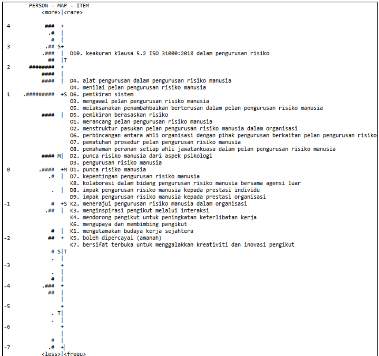
Rajah 2. Pemetaan Item-Individu bagi INPERISMA

K7 (bersifat terbuka untuk menggalakkan kreativiti dan inovasi pengikut) merupakan item yang paling mudah dipersetujui oleh responden. Julat logit bagi item iaitu di antara +2.60 hingga -2.3 menunjukkan bahawa sebaran item berada di antara logit +3.0 hingga -3.0 boleh dianggap nilai yang baik dan memenuhi andaian model pengukuran Rasch (Andrich & Styles, 2004). Berdasarkan pemetaan item-individu ini didapati bahawa min individu adalah lebih tinggi berbanding min item.